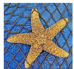
Etoile de mer