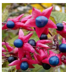
Arbre du clergé (Clerodendrum trichomum)