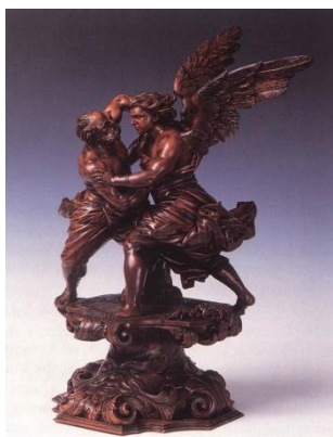
A. Brustolon in www.artbible.net