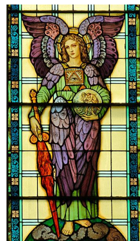
Cherub in a window at Our Lady of the Lake Church, in Ashland, Wis. http://www.thecompassnews.org/