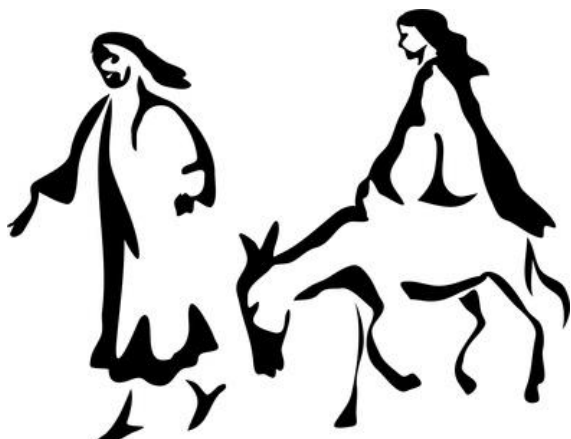
Prawny « Marie et Joseph, voyage à Bethléem », XXIe siècle