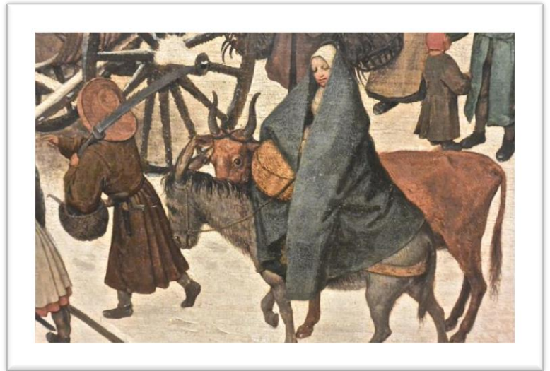
Pieter_Brueghel, l'Ancien « Le Dénombrement de Bethléem », détail , XVIe siècle