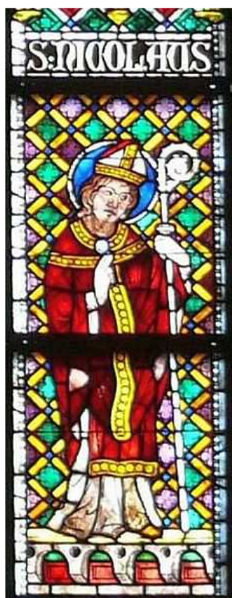
Vitrail de Saint Nicolas dans l'abbaye cistercienne de Hauterive.