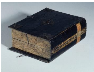
Musée de la musique, Paris, N inv. E 305